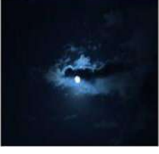
रात , रजनी