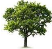
पेड़ , वृक्ष