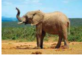
गज , हाथी