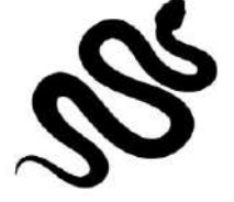
साँप , सर्प