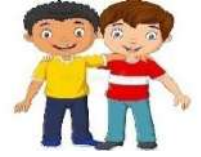
मित्र , सखा